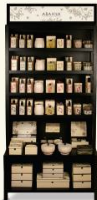
Аваһпа стеллаж H1770mm x w740mm x d320mm